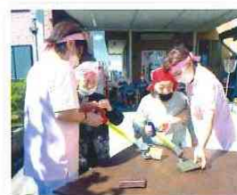
ミニミニ運動会開催