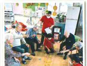
敬老の日 ゲーム大会